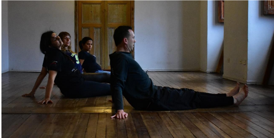
Acciones físicas, posturas y conciencia corporal, Imagen: Archivo de la Corporación.

En este punto es de gran relevancia la historia corporal del participante, sus antecedentes médicos y como estos han influenciado en la manera en que es percibido el cuerpo y su disposición física en los distintos entornos en los cuales se desenvuelve. Entonces se descubren diversas situaciones que conllevaron a la casi negación de ciertas acciones físicas, produciendo en los participantes de la escuela bajos niveles de tolerancia al dolor, de voluntad, posturas habituales que perjudican su cuerpo.