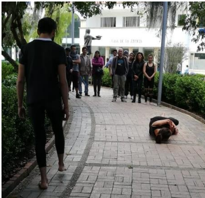
Muestra del proceso.

estudiante de su “coreografía”. Algunas parejas logran intercambios y negociaciones fructíferas tanto para su proceso individual como para la estructura en sí. Sin embargo, en otros se convierte en una conversación compleja en cuanto a los cuerpos, sus posibilidades escénicas, la relación subjetiva y el espacio escénico que debe ser escogido por cada dúo a partir de premisas como la ubicación del espectador, la relación del ejercicio con la topografía.