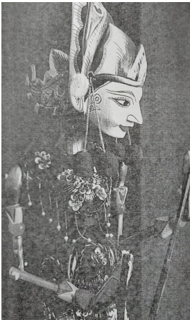
Figura 3. Wayang Golek, Títeres Tridimensionales construidos en madera que se operan desde abajo mediante cañas o varillas, y se muestran directamente al público sin telón. (Gomez Acevedo , 2016)

Según Genua "...el teatro de títeres ayuda al afianzamiento de la personalidad y potencia el trabajo en equipo" (Enkami, 2009) afirma que además, siendo esto un aprendizaje significativo que favorece habilidades comunicativas, las cuales servirán para su desempeño frente a la sociedad, en tanto a su reconocimiento dentro del territorio, y su papel como sujetos sociopolíticos con una mirada crítica del mundo que les rodea.