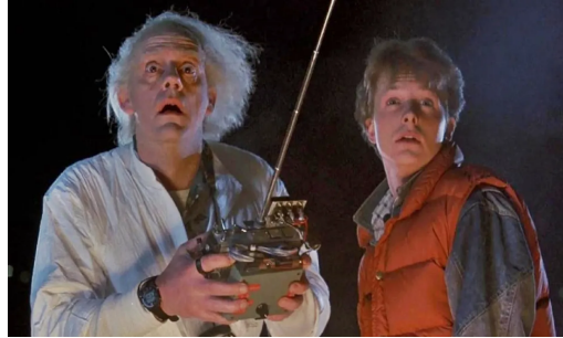
Figura 5. Imagen de la película: 'Regreso al futuro'. (1985). El doctor Emmet Brown construye una máquina del tiempo.

Por lo cual, esta película, también fue un referente que se compartió con los participantes y se tuvo en cuenta como un ejemplo del artefacto a construir de la maquina del tiempo, cada elemento, material, color, composición, podía dar sentido a las apuestas creativa, al igual, que al sentido de lo que se quisiera recordar.