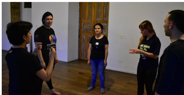
Clases iniciales, Imagen: Archivo de Inconsciente Colectivo.

Inicialmente se da a conocer la experiencia de aprendizaje-enseñanza desarrollado al interior de la Corporación Inconsciente Colectivo de Zipaquirá, dando cuenta del proceso formativo en relación al cuerpo y su decolonización como tránsito a un ejercicio creativo que tuvo por nombre Kurku.