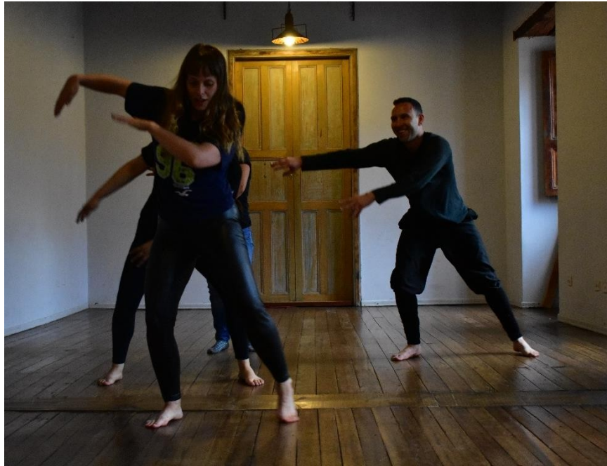
Exploración de partituras corporales, Imagen: Archivo de la Corporación.

El ejercicio sugiere una suerte de poema con las respuestas y esta es precisamente la ruta a seguir, cada uno toma su texto y desarrolla una partitura corporal desde su relación con el entorno y un objeto con el cual tenga afinidad, aquí entramos en la memoria emotiva que en el teatro busca la intervención de los recuerdos para hacerlos partícipes en la escena.