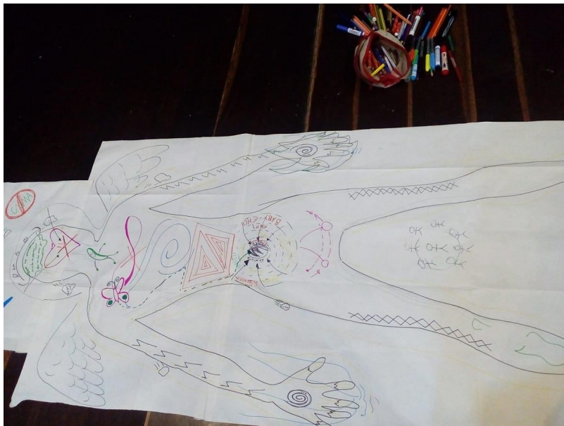
Avance de una cartografía.

Garavito en su texto Escritos escogidos expone, “la subjetivación, gracias a su relación con el afuera, es la creación de un nuevo modo de existencia. Pero un nuevo modo de existencia es la creación de nuevo campo de afección y percepción” (Garavito E, pág. 131) es así como se puede afirmar que las relaciones de poder y saber frente al cuerpo decolonizado posibilita otros modos de existencia y conciencia física tanto en la escena como en la cotidianidad.