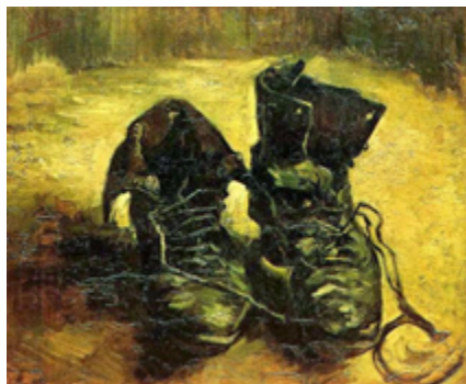
Figura 2 Van Gogh, V (1886). Un par de zapatos.

No solo Salvador Dalí, tenía un concepto importante del tiempo, también lo vemos en las obras de Neerlandés Vincent Van Gogh (1853-1890), que transmitía en sus cuadros el movimiento del viento, el anochecer, unos zapatos viejos y rotos, un reloj que encuadrar su pintura, pueblos viejos y solitarios, flores marchitas y en otras obras pintorescas, elementos que resaltan, la función del tiempo, en los elementos que le rodean; destacando lo viejo y lo antiguo en su estilo de pintar y en los colores que utilizaba; destacando no un cuadro congelado, sino un movimiento que domina el transcurrir del tiempo, un respeto que le tenía a este espíritu que nos domina, sabiendo que era poco lo que viviría, con respecto a todo lo que quería. "Desde luego que, para el arte, donde se tiene necesidad de tiempo, no estaría mal vivir más de una vida" (Van Gogh.1882).