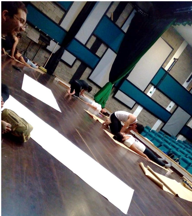
Elaboración de la cartografía. Imagen, archivo personal.

Entonces se asume la metodología como un espacio de reconocimiento interior abordado bajo la premisa de la escritura casi automática, y sin tener en cuenta las habilidades plásticas de cada participante. La sensación de subjetividad y descubrimiento de sensaciones y la percepción de explorar y exponer emociones desde códigos o símbolos personales, es una de las ventajas de la Cartografía Corporal.