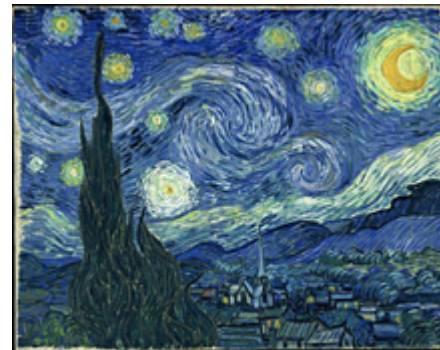
Figura 3. Van Gogh, V (1889). La noche estrellada.

Esta musa de grandes artistas que condenaron lo abstracto por lo visible, entendiendo la función de este verdugo como lo es el tiempo, mostrando su esencia, su visión estética en forma simbólica y clara. "Una cosa