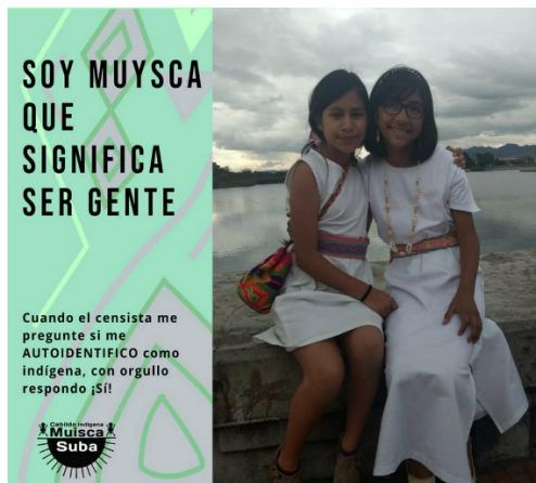
Figura 5

Lo increíble de los títeres dentro del proceso educativo es que pueden ser usados en cualquier nivel académico, e incluso en procesos de gestión cultural social, pudiendo llevar mensajes a los diferentes sectores y/o estratos de la sociedad, dejando mensajes desde, valores y fortalecimiento de vínculos afectivos en el hogar, hasta historias grandiosas sobre el universo o grandes héroes y heroínas, cómo lo vimos en un apartado más arriba.