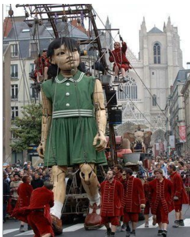
Figura 2. La Pequeña Gigante.

se puede ver en la figura seguida a este párrafo, una relación muy fraternal con los títeres de varilla y las marionetas de hilos.