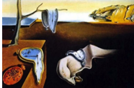
Figura 1. Salvador, D. (1931). Perseverancia de la memoria.

La musa para grandes pintores como Salvador Dalí (1904-1989), y en su obra: 'Persistencia de la memoria', que pensaba en el tiempo, como una estrella fugaz que desaparece, que afecta en la memoria, que desvanece el pasado, derritiéndose en sus relojes que se desvanecen a causa de un olvido, a causa del tiempo que condena a todo aquel que pisa este mundo sin importar si es un ser o un objeto que ya existe o existirá. "Podéis estar seguros de que mis famosos relojes blancos no son otra cosa que el queso Camembert del espacio y el tiempo, que es tierno, extravagante, solitario y paranoico-crítico" (Salvador Dalí, 1935).