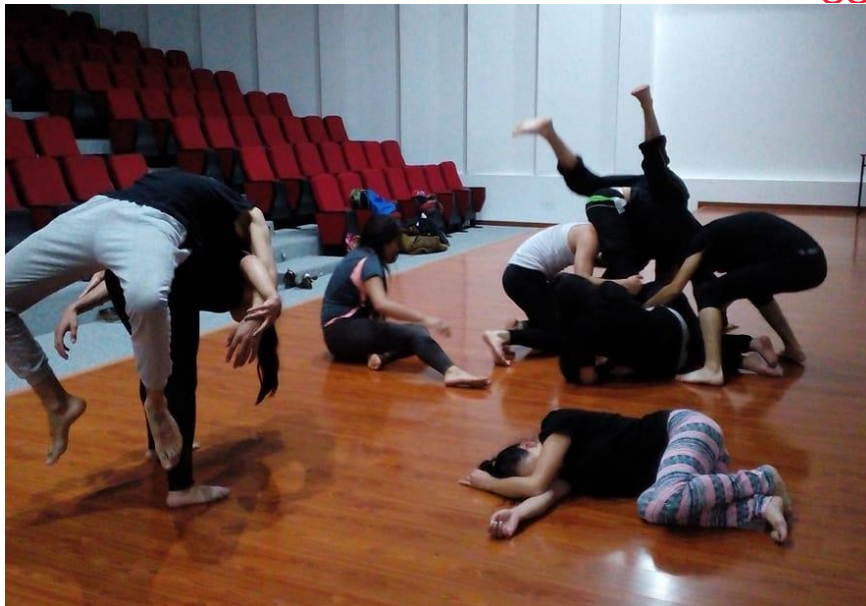
Diagnóstico inicial del grupo.

Cabe resaltar que el objetivo fue también la posibilidad creadora del estudiante desde su investigación corporal, su reconocimiento y subjetividad para dar paso a la de-construcción de movimiento, aspecto técnico y propio del Seminario y sobre el cual hace referencia el bailarín y coreógrafo Álvaro Fuentes Medrano en su texto El Dramaturgista y la de-construcción del movimiento .