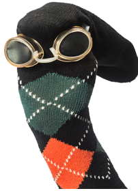
Figura 3. Calcetín con rombos man

Unidos, Cuba, Argentina y Colombia.” (Gomez Acevedo , 2016). En África, los títeres son usados en rituales de iniciación en el paso del joven a adulto. Así en cada región del mundo se le fue dando diferentes significados al arte de los títeres.